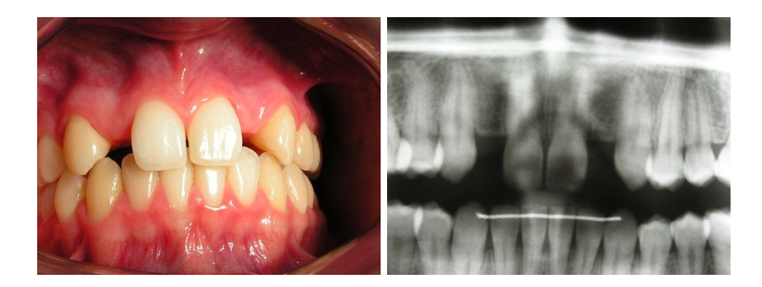
Fig. 3: Clinical situation before implant therapy (case 2).

Fig. 4: Panoramic radiograph before implant treatment (case 2).