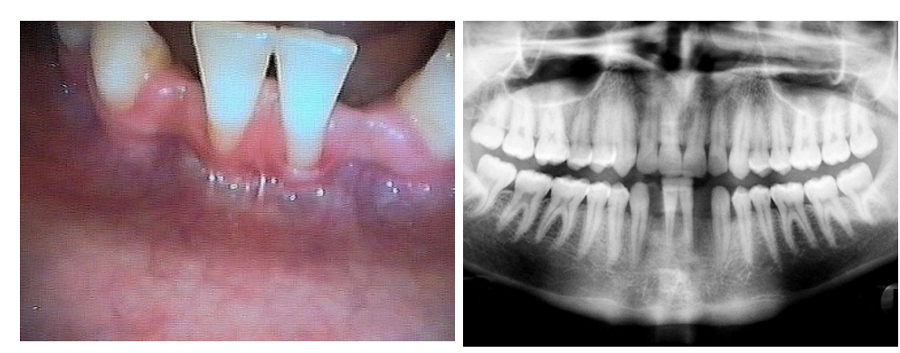
Fig. 1: Clinical situation before implant therapy (case 1).

By two healthy patients, a 18-year-old male non-smoker with aplasia of the lateral incisors in the lower jaw and a 17-year-old female smoker (10 cig./day) with aplasia of the lateral incisors in the upper jaw, a intercoronal space of 5 mm was existing . Both patients were pre-treated by orthodontists. It was decided after execution of the clinical and radiological examination and evaluation of the won information to advertise 2.7 mm BEGO-Compress-Implants (15 mm of length). In the first case the improvement in the soft tissue situation was carried out in the front-end by means of connective tissue grafts while in the second case this was carried out during the implantation meeting. In both cases the implants were inserting after the usual surgical protocol. An exception was the use of the nonablative thread moulder for bone condensing and for bone spreading. Vestibulär pitches of screw thread which were covered with autological bone material lay in all Op areas freely. A bone substitute became on this material Biobase (Zimmer Dental; case 1) and bonit matrix (DOT GmbH; case 2) found as a dummy. A cover with membrans (case 1: Biomend, Zimmer Dental; case 2: Cytoplast non resorb, ORALTRONICS GmbH) was carried out. The wound healing was unobtrusive in both cases. After 3 months (case 1) and 6 months (case 2) the implants were loaded with single crowns.