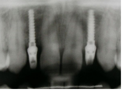
Fig. 7: Clinical view after 2 years later (case Fig. 8: Panoramic radiograph 2 years after implant therapy (case 2).

This Poster was submitted by Dipl.-Stom. Michael Kirsch.